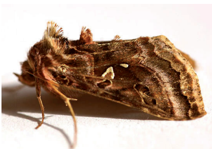
Autographe couleur chatain