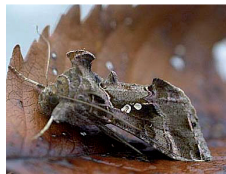
Autographe du soya