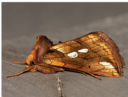
Autographe des Carex