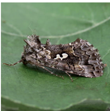
Autographe des épinettes