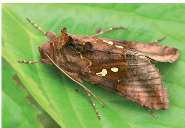
Autographe à deux points